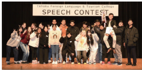
スピーチコンテスト