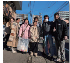
まちクリーン活動