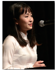
スピーチコンテスト