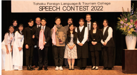
スピーチコンテスト