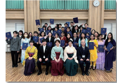
みんな笑顔で卒業